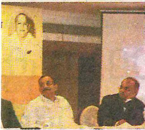
3. നായർ അനുസ്മരണച്ചടങ്ങിൽ