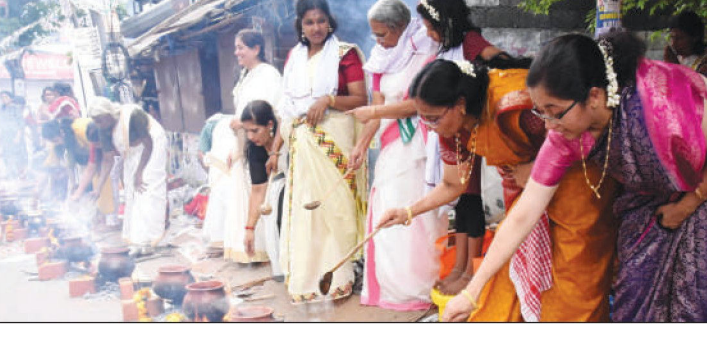
• എറണാകുളം പാവക്കുളം ശ്രീമഹാദേവ ക്ഷേത്രത്തിലെ പൗർണ്ണമി പൊങ്കാല മ ഹോൽസവത്തിന് സമാപനം കുറിച്ചു പൊങ്കാല സമർപ്പിക്കുന്ന വിശ്വാസികൾ ..