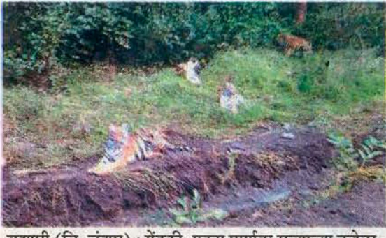
ब्रह्मपुरी (जि. चंद्रपूर) : मेंडकी, एकरा मार्गावर रस्त्याच्या कडेला एकाच वेळी विश्रांती घेत असलेले वाघ.