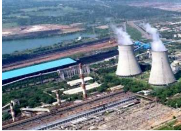
POWERING UP. NLC India is also implementing 5.7 GW of coal-fired projects

NLC India is also implementing 5.7 GW of coal-fired projects that include the 1980 MW project of Neyveli Uttar Pradesh Power Ltd, A Joint Venture between NL-