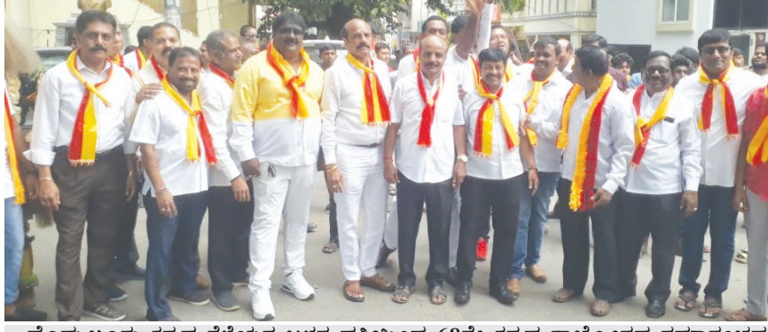
ದೊಮ್ಮಲೂರು ಕನ್ನಡ ಗೆಳೆಯರ ಬಳಿಗೆ ವತಿಯಿಂದ 68ನೇ ಕನ್ನಡ ರಾಜ್ಯೋತ್ಸವ ಸಮಾರಂಭವನ್ನು ಭಾರಿ ವಿಜೃಂಭಣೆಯೊಂದಿಗೆ ದೊಮ್ಮಲೂರು ರಾಜಬೀದಿಗಳಲ್ಲಿ ಶ್ರೀ ಭುವನೇಶ್ವರಿ ದೇವಿಯ ಪಲ್ಲಕ್ಕಿಯೊಂದಿಗೆ ಮೆರವಣಿಗೆ ನಡೆಸಲಾಯಿತು. ಚಿತ್ರದಲ್ಲಿ ಸಮಿತಿಯ ಪದಾಧಿಕಾರಿಗಳು, ಸದಸ್ಯರು ಹಾಗೂ ನಾಗರಿಕರು ಭಾಗವಹಿಸಿದ್ದರು.