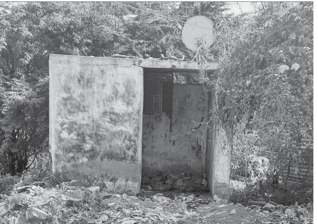
ડભોઈ નગરપાલિકામાં અગાઉના વહીવટકર્તાઓએ ચારે ભાગોળ તરફે ગરીબ વર્ગ ઉપયોગમાં લઈ શકે તેવા હેતુથી બહેર શૌચાલયોનું નિર્માણ કર્યું હતું જેનું હાલના વહીવટકર્તાઓએ ચોંચ રીતે સંચાલન કે મારામત ન કરાવતા ખખડધજ હાલતમાં આવી ગયા છે અને તદ્દન ઉપયોગ વિનાના થઈ પડ્યા છે જે તસવીરમાં નજરે પડે છે.

(પ્રતિનિધિ) ડભોઈ, તા.૧૭ ડભોઈ નગરપાલિકા દ્વારા ચોવીસ વર્ષ અગાઉ બહેર શૌચાલય બનાવવામાં આવ્યા હતા જે આજે ગંદકીથી ખટખટી રહ્યા છે અને શૌચાલયના દરવાબ પણ ખખડધજ થઈ ખલાસ થઈ ગયેલા છે. બાજુ અને મૂતરડીના અત્યંત દુર્ગંધવાળા મળમૂત્રનો બહેરમાં ફેલાવો થઈ રહેલ છે અને તેની આગળ જ કચરાના ઢગલાઓ પણ કરવામાં આવેલ છે આ શૌચાલયમાં પાણીની કોઈ સુવિધા પણ નથી જેથી આસપાસમાં ગુપ્તપત્રીમાં રહેતા ગરીબ કુટુંબોને બળી બખરા કે ખુલા મેદાનમાં જ શૌચક્રિયા માટે નાણુકે જવું પડે છે ડભોઈ નગરપાલિકા દ્વારા સરકારી શૌચાલયની સુવિધા માટે કોઈ પગલા