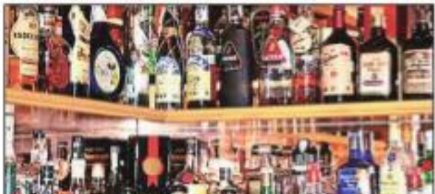
अब तक इस संबंध में आधिकारिक आदेश जारी नहीं किया है।

अधिकारियों ने बताया कि उपराज्यपाल ने दिल्ली सरकार के प्रस्ताव को मंजूरी दे दी है। उन्होंने बताया कि सरकार ने आबकारी नीति 2021-22 को एक महीने के लिए बढ़ाने का प्रस्ताव रविवार की देर रात मंजूरी के वारसे उपराज्यपाल को भेजा था। आबकारी विभाग ने