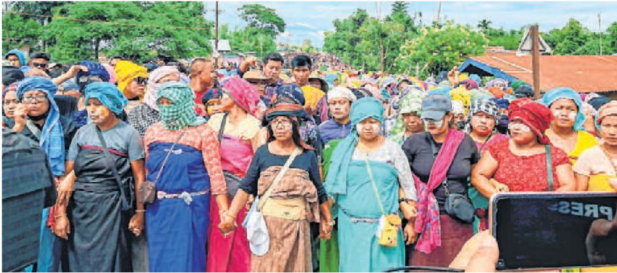
Hundreds of protesters during a protest at Phougakchao Ikhai, in Manipur's Bishnupur district