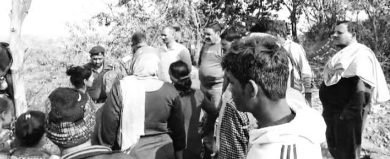
भोरंज के पट्टा बाजार में मौके पर छानबीन करती पुलिस।