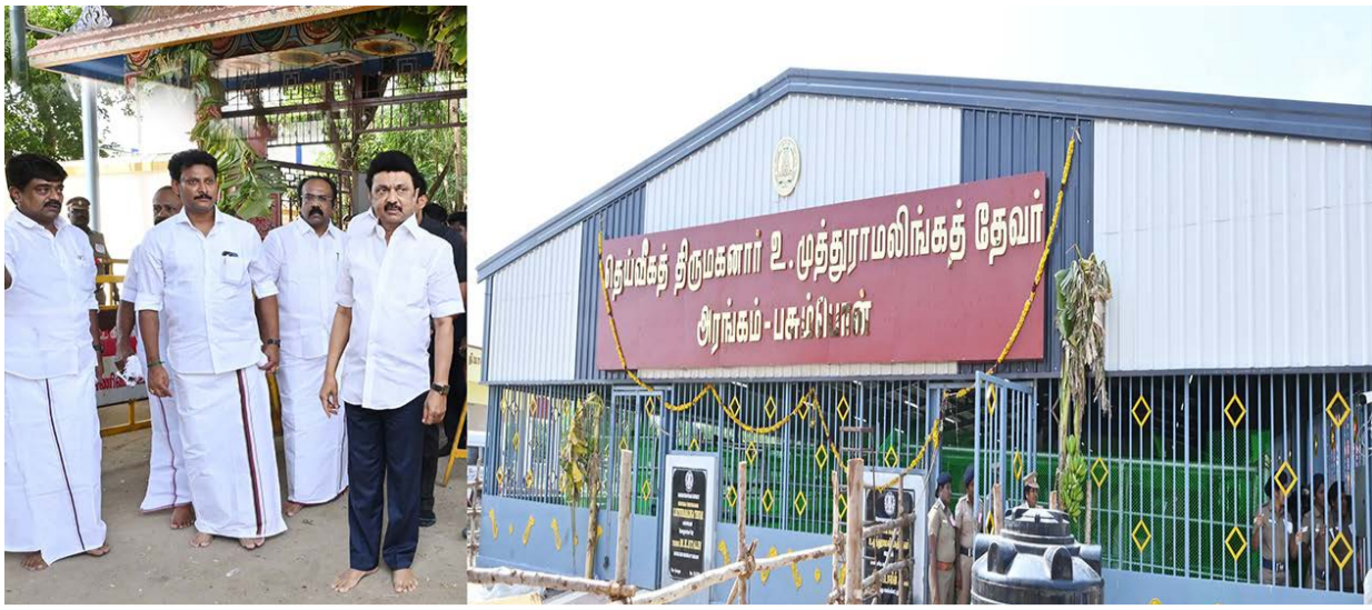
முதலமைச்சர் மு.க.ஸ்டாலின் இன்று ராமநாதபுரம் மாவட்டம், பசும்பொன்னில் புதிதாக அமைக்கப்பட்டுள்ள முத்துராமலிங்கத் தேவர் அரங்கத்தினை பார்வையிட்டார்.