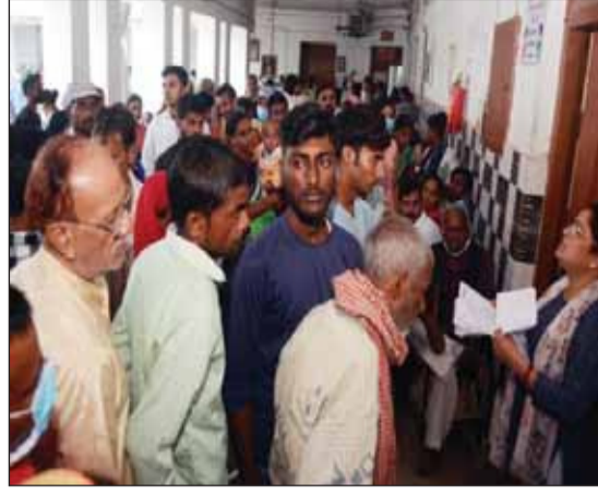
अस्पताल में जांच कराने आये लोग।

डीएम ने अधिकारियों के साथ आवासों का स्थलीय निरीक्षण कर दिए निर्देश