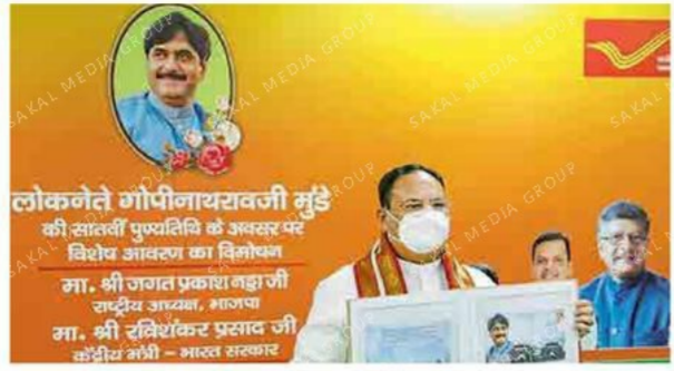
नवी दिल्ली : गोपीनाथ मुंडे यांच्या स्मृतिप्रीत्यर्थ टपाल पाकिटाचे अनावरण.

गोपीनाथ मुंडे यांच्या सातत्या पुण्यतिथीनिमित्त त्यांच्यावरील खास टपाल पाकिटाचे प्रकाशन नड्डा व दूरसंचारमंत्री रविशंकर प्रसाद यांच्या