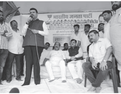
आंदोलन आपण पुढे नेऊ. भाजपची मागणी आहे.