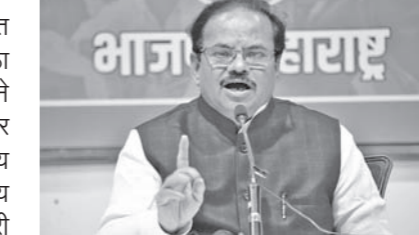
यावर्षी ‘महाबीज’ या राज्य सरकारच्या बियाणे उत्पादक कंपनीने ३० किलोच्या पिशवीची किंमत ४ हजार, २५० रु. केल्याने शेतकऱ्यांना मोठा आर्थिक फटका बसणार आहे. ‘महाबीज’ने बियाणांच्या किमतीत वाढ केल्याने खासगी बियाणे कंपन्यांनीही दरवाढ केली आहे. काही महिन्यांपूर्वी केंद्र सरकारने खाऱ्यांच्या किमतीत वाढ झाल्यानंतर शेतकऱ्यांना अनुदान दिले होते. त्याच पद्धतीने राज्यातील आघाडी सरकारने सोयाबीन

मुंबई, दि. २७ (प्रतिनिधी): “महाबीज’ने सोयाबीन बियाणांच्या किमतीत दोन हजारांनी वाढ केल्याने शेतकऱ्यांना मोठा भुईद बसणार असल्याने राज्य शासनाने सोयाबीन उत्पादकांना प्रतिष्ठा २ हजार रु. अनुदान द्यावे,” अशी मागणी भारतीय जनता पक्ष (भाजप) किसान मोर्चाचे राष्ट्रीय सरचिटणीस डॉ. अनिल बोंडे यांनी शुक्रवारी केली. भाजप प्रदेश कार्यालयात झालेल्या पत्रकार परिषदेत डॉ. बोंडे बोलत होते. “विविध कारणांमुळे अडचणीत आलेल्या राज्यातील कांदा आणि संत्रा उत्पादक शेतकऱ्यांनाही राज्य सरकारने मदत करावी,” अशी मागणीही डॉ. बोंडे यांनी केली.