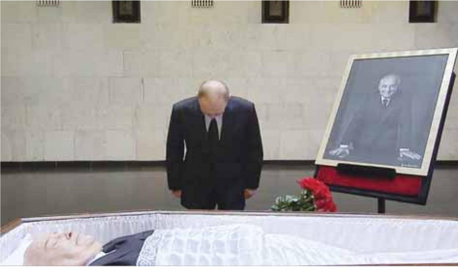
ताबूत पर पुष्प अर्पित कर उन्हें व्यक्तिगत रूप से श्रद्धांजलि दी थी।

श्रीत युद्ध को खत्म करने में मदद करने वाले बड़े सुधारों की शुरुआत करने वाले सोवियत संघ के पूर्व नेता मिखाइल गोर्बाचेव को शनिवार को बड़ी संख्या में लोगों ने श्रद्धांजलि दी। गोर्बाचेव का मंगलवार को निधन हो गया। वह 91 वर्ष के थे। यूरोप को विभाजित करने वाली राजनीतिक सीमा खत्म करने के लिए गोर्बाचेव को पश्चिमी देशों में सराहा जाता है, लेकिन सोवियत संघ के विघटन के लिए जिम्मेदार रहे उनके कदमों के कारण रूस में उनके कई आलोचक हैं। गोर्बाचेव की राजकीय अंतर्दृष्टि किए जाने की घोषणा करने से क्रेमलिन का इनकार करना दिवंगत नेता की विरासत को लेकर रूसी राष्ट्रपति कार्यालय की असहजता को दर्शाती है। पुतिन ने बृहस्पतिवार को गोर्बाचेव के