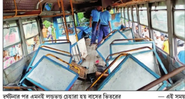
দুর্ঘটনার পর এমনই লডভভ চেহারা হয় বাসের ভিতরের

কলকাতা থেকে ঘটকপুকুরের দিকে যাচ্ছিল বটানিক্যাল গার্ডেন-ধামাখালি রুটের বাসটি। বুধবার দুপুর একটা নাগাদ ভোজেরহাটের বৈরামপুরের কাছে উল্টো দিক আসা একজন বাইক আরোহী একটি গাড়িকে ওভারটেক করতে গিয়ে একেবারে বাসের মুখোমুখি চলে আসেন। বাইক আরোহীকে বাঁচাতে গিয়ে বাসের চালক রাস্তার বাঁ পাশে গাড়ি ঘুরিয়ে দেন। তা করতে গিয়েই