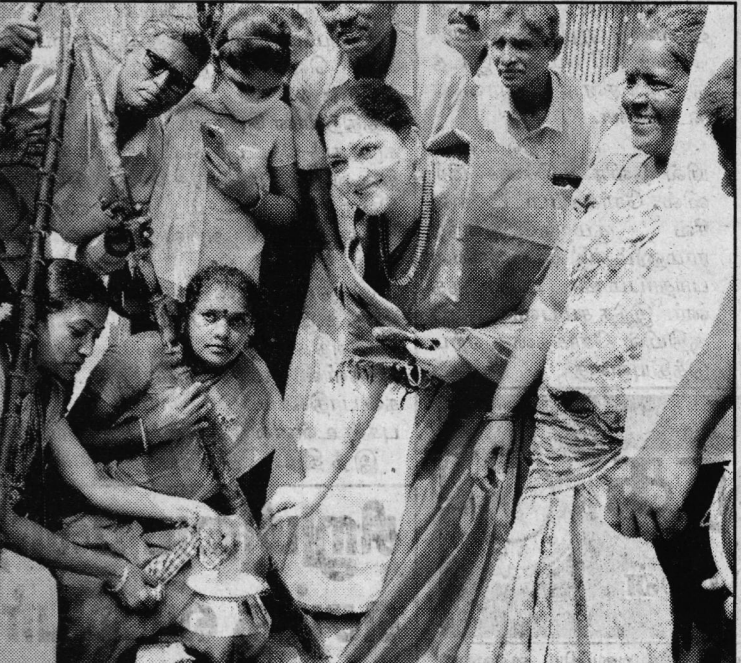
முழுவெயொட்டி பா.ஜ.க. மீனவர் அணியினர் கடற்கரை நடுக்குப்பத்தில் ஏற்பாடு நடிகை குஷ்பு தொண்டர்களுடன் பொங்கல் வைத்தார். அருகில் மீனவர் அணி உட்பலர் உள்ளனர்.

பொங்கல் பாணை பொங்குவதைப் போன்று மக்களின் வாழ்வில் வளங்களும், நலங்களும், பொங்கலும், கரும்பும், சர்க்கரை பொங்கலும் இனிப்பதைப் போன்று தமிழர்களின் வாழ்க்கை இனிக்கட்டும்; மஞ்சள் மற்றும் இஞ்சியின் மருத்துவ குணம் கிருமிகளை அழிப்பதைப் போன்று நமது வாழ்க்கையில் நாம் எதிர்கொள்ளும் அனைத்து நெருக்கடிகளும் விலகட்டும். ஒட்டு மொத்தமாக, தமிழர்களின் வாழ்க்கையில்