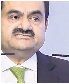
Gautam Adani cited his group's record earnings, robust cash positions, low debt ratios.

Billionsaire Gautam Adani on Monday cited his group's record earnings, robust cash positions and low debt ratios to state that his ports-to-energy conglomerate was stronger than ever and its best is yet to come.