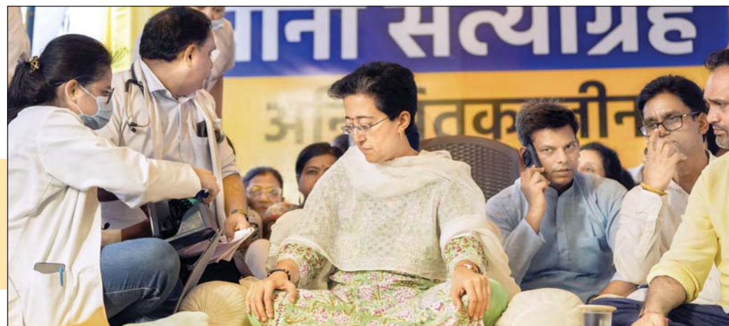
हरियाणा से दिल्ली के हिस्से का पानी दिलाने की मांग को लेकर जंगपुरा भोगल में सत्याग्रह पर बैठीं दिल्ली सरकार की जल मंत्री आतिशी

■ हमारे लिए दिल्ली के हिस्से पानी दिलाना प्राथमिकता : आतिशी