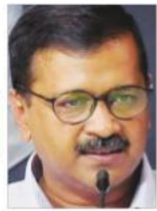
पर्यावरण एवं वन मंत्री गोपाल राय ने वृक्षारोपण महाअभियान के तहत लक्ष्य से ज्यादा पौधे बांटने की अपील की।

केजरीवाल ने ट्विटर पर लिखा कि मौजूदा समय के आधार पर प्रदूषण की पहचान करने के हमारे नए प्रयास ने परिणाम दिखाना शुरू कर दिया है। प्रदूषण के खिलाफ ऐसा प्रयास भारत में पहली बार हो रहा है। हम बेहतरीन तकनीक और बेहतरीन दिमागों का इस्तेमाल कर रहे हैं। इस बीच दिल्ली सचिवालय में पर्यावरण एवं वन मंत्री गोपाल राय ने भी घटते प्रदूषण का दावा कर कहा कि दिल्ली सरकार द्वारा उठाए गए