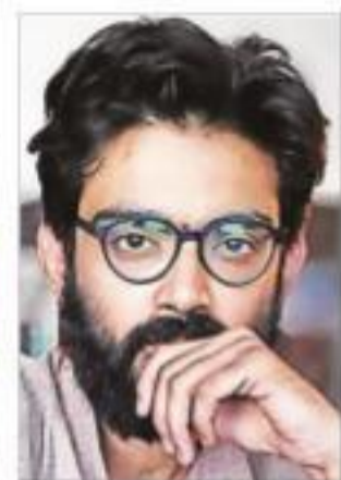
मामला दिसंबर 2019 में जािमिया और आसपास के इलाकों में हुई हिंसा से जुड़ा हुआ है। जािमिया नगर थाने में मामला दर्ज किया गया था।