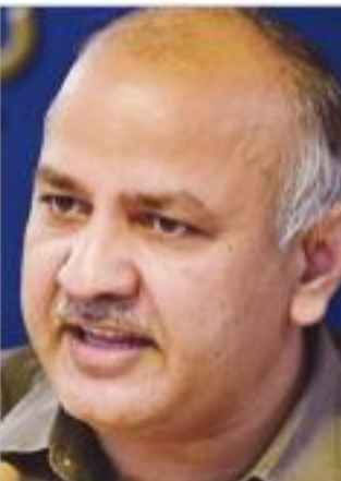
1.3 लाख लोगों को सीवर की समस्या से राहत मिलेगी। 27,740 घर सीवर कनेक्शन जोड़े जाएंगे।

यमुना सफाई के मद्देनजर दिल्ली सरकार ने फैसला किया है कि बादली विधानसभा की 14 कालोनियों व गांव को सीवर सुविधा से जोड़ा जाए। इसी के तहत उपमुख्यमंत्री मनीष सिसोदिया ने दिल्ली जल बोर्ड को बादली विधानसभा क्षेत्र के सभी घरों में सीवर लाइन कनेक्शन देने की योजना को स्वीकृति दी है। 28 करोड़ रुपए लागत वाली इस परियोजना के पूरा होने के बाद इलाके की कालोनियों और गांव के करीब 1.3 लाख लोगों को सीवर की समस्या से राहत मिलेगी।