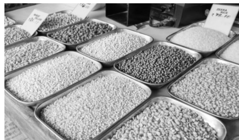
Traders may be asked to disclose stocks held by them in a centralised portal to ensure smooth monitoring of inventory

"The Centre wants private stocks held with traders to come into the market