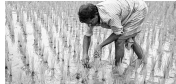
Sowing of kharif crops as on Aug 12 (In mn hectares)

According to the India Meteorological Department (IMD), between June 1 to August 12, cumulatively across the country the southwest monsoon is around 8 per cent more than normal but in major paddy growing states of UP (-44 per cent), West Bengal (-21 per cent), Jharkhand (-41 per cent), and Bihar (-38 per cent). In Telangana, which is another major paddy-growing state, crops have been damaged due to excess rains (+78 per cent).