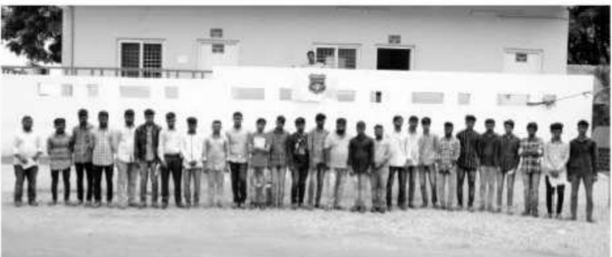
షీటీమ్ అదుపులో ఉన్న పోకిరీలు