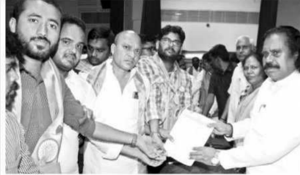
జాతీయ ఎస్టీ కమిషన్ చైర్మన్ కు వివరణ ఇవ్వడం