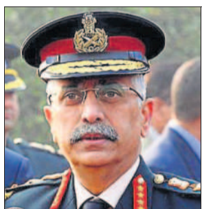
Gen Manoj Mukund Naravane

NEW DELHI: Indian Army chief General Manoj Mukund Naravane will head for Kathmandu on Wednesday on a three-day visit that is expected to smoothen bilateral ties with Nepal after a bitter border row, especially by building on the traditionally strong military relationship between the two countries, officials familiar with developments said on Tuesday. Naravane will be in Nepal during November 4-6, when he will meet his Nepalese counterpart General Purna Chandra Thapa and top civilian leaders. Nepal's President Vidya Devi Bhandari will confer the honorary rank of general of the Nepali Army to Naravane at an investiture ceremony on November 6, the officials said. Bilateral ties were hit in May after defence minister Rajnath Singh inaugurated a key border road to Lipulekh region, which