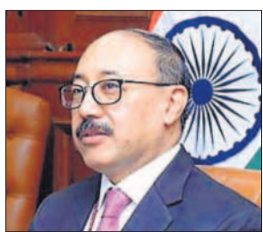
Harsh V Shringla

NEW DELHI: The rise of China and the need for global rebalancing have contributed to the current focus on the Indo-Pacific, a region through which 90% of India's international trade travels, foreign secretary Harsh Shringla said on Tuesday. Speaking at the think tank Policy Exchange in London on the theme "India's vision of the Indo-Pacific", Shringla outlined New Delhi's plans to work with other countries across the region to ensure a rules-based order, maritime security and stability. "The Indo-Pacific ocean system carries an estimated 65% of world trade and contributes 60% of global GDP. Ninety per cent of India's international trade travels on its waters, he said, noting that the shift in the economic trajectory from the Atlantic to