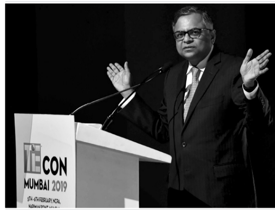
मुंबई में आयोजित टीआईसीओएन के एक कार्यक्रम को संबोधित करते टाटा संस के चेयरमैन एन चंद्रशेखरन -कमलेश पेडणेकर

ट्राई ने 700 मेगाहर्ट्ज बैंड की रेडियोवेक्स में प्रति मेगाहर्ट्ज 6,568 करोड़ रुपये आधार मूल्य की सिफारिश की है। इससे एयरवेक्स का कुल मूल्य करीब 65,680 करोड़ रुपये