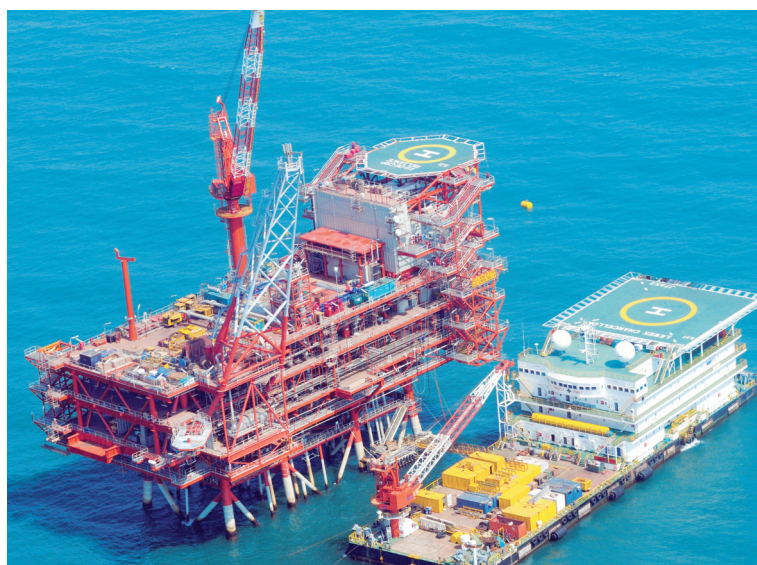
The Delhi HC ruling clears the path for the government to enforce its claim of around $1.7 billion against RIL and its foreign partners.

government, granting it the rights to explore and extract natural gas from the KG basin, located off the coast of Andhra Pradesh. The contract detailed the responsibilities, entitlements and revenue-sharing arrangements between the parties involved. Between 2006 and 2007, RIL reportedly drilled four development wells and began commercial production on 1 April 2009. Its KG-D6 block is situated adjacent to ONGC's Godavari Petroleum and Mining Lease (PML) and the KG-DWN-98/2 block. RIL holds a 60% stake in the KG-D6 block, with BP PLC owning 30% and Niko Resources holding the remaining 10%. In July 2013, ONGC informed the Directorate General of Hydrocarbons (DGH) of evidence suggesting lateral continuity of gas pools between its fields