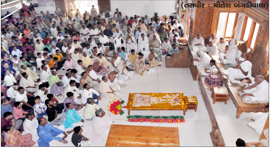
શ્રી વેસુ તપાગચ્છ જેન સંઘ દ્વારા રામવિહાર ખાતે જ્ઞાન પંચમીના શુભ દિવસે ઠપ આગમના દર્શન યોજાયા હતા.