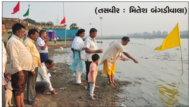
મુહેલી પરી હતી, જે વહીવટી તંત્ર (સુરત મહાનગર પાલિકા)ના સહયોગથી સંપન્ન થઈ રહી છે. આ કાર્યક્રમમાં દર વર્ષે ૫૫થી ૬૦ હજાર જેટલા ભક્તો ભાગ લેવા આવે છે. કોરોના રોગચાળા પછી, આ વર્ષે વધુ લોકો આવવાની ધારણા છે, જેને ધ્યાનમાં રાખીને બિહાર વિકાસ પરિષદ દ્વારા તમામ પ્રકારની વ્યવસ્થા કરવામાં આવી છે. ઘાટની સંપૂર્ણ સફાઈ, યોગ્ય લાઈટિંગની વ્યવસ્થા કાયમી શોચાલયની જોગવાઈ કરી રહી છે.

ખબકાર પ્રતિનિધિ, સુરત, તા. ૨૯ દર વર્ષની જેમ, બિહાર વિકાસ પરિષદ, સુરત દ્વારા આ વર્ષે તાપી બીચ, ઈસ્કોન મંદિરની પાછળ, જહાંગીરપુરા, સુરત ખાતે છઠ પૂજાનું આયોજન તા. ૩૦ને રવિવારના રોજ અસ્ત સૂર્ય (સંધ્યા અર્ધ) સાથે કરવામાં આવી રહ્યું છે. તા. ૩૧ના રોજ, ઉગતા સૂર્યને અર્પણ કરીને છઠ પર્વની પૂર્ણાહુતિ થશે. આ વર્ષે મોટી સંખ્યામાં છઠવતી અને તેના પરિવારોના આગમનની સંભાવનાને ધ્યાનમાં રાખીને, પરિવહન પદાધિકારીઓ અને કાર્યકરો, સહયોગથી સંપન્ન થઈ રહી છે. આ કાર્યક્રમમાં દર વર્ષે ૫૫થી ૬૦ હજાર જેટલા ભક્તો ભાગ લેવા આવે છે. કોરોના રોગચાળા પછી, આ વર્ષે વધુ લોકો આવવાની ધારણા છે, જેને ધ્યાનમાં રાખીને બિહાર વિકાસ પરિષદ દ્વારા તમામ પ્રકારની વ્યવસ્થા કરવામાં આવી છે. ઘાટની સંપૂર્ણ સફાઈ, યોગ્ય લાઈટિંગની વ્યવસ્થા કાયમી શોચાલયની જોગવાઈ કરી રહી છે.