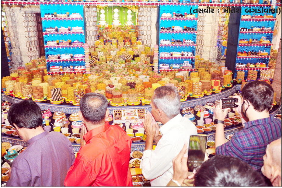
નૂતન વર્ષના મંગલ પ્રારંભે અડાજણ બીએપીએસ સ્વામિનારાયણ મંદિરમાં અન્નકુટોત્સવ ઉજવાયો હતો.