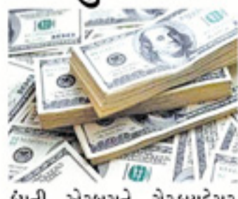
કંપની એરબસને ગેરકાયદેસર રીતે મદદ કરી રહ્યું છે. જેના અનુસંધાનમાં નિર્ણય લેવામાં આવ્યો હતો. યુરોપિયન સંઘના એક નેતાએ જણાવ્યું હતું કે આગામી અઠવાડિયે મંગળવાર અથવા બુધવારે અમેરિકી ઉત્પાદનો પર ટેરિક લાદવામાં આવશે. બીજા તરફ અમેરિકાનો તર્ક છે કે યુરોપિયન સંઘના ટેરિક માટે કોઈ કાયદાકીય આધાર નથી કેમ કે ઓઈગને અપાતી સબસીડી બંધ કરી દેવાઈ છે. બંને પક્ષો એકબીજા પર વર્લ્ડ ટ્રેડ ઓર્ગનાઈઝેશનના નિયમોનું પાલન કરવામાં નિષ્ફળ રહ્યા હોવાના આરોપો લગાવી રહ્યા છે.

વોશિંગ્ટન/લંડન, તા.૭ યુરોપિયન યુનિયને અમેરિકાના ઉત્પાદનો પર ૪ અબજ ડોલરની ટેરિક લાદવાની તૈયારીઓ આદરી છે. યુરોપિયન સંઘની બહુમતી સરકારોએ અમેરિકન વસ્તુઓની આયાત પર ટેરિક લગાવવાના નિર્ણયનું સમર્થન કર્યું છે. અમેરિકામાં રાષ્ટ્રપતિની ચૂંટણીને લઈને ટેરિક અંગે નિર્ણય લેવાયો નહોતો પણ હવે મતદાનના દિવસે જ ઈયુએ અમેરિકી ઉત્પાદનો પર ટેરિક લગાવવાની તૈયારી કરી હતી. આ અગાઉ વિશ્વ વ્યાપાર સંગઠને અમેરિકાને યુરોપિયન સંઘ પર ૭.૫ અબજ ડોલરના માલ પર ઈંચી આયાત ડ્યુટી લગાવવાની મંજૂરી આપી હતી. ડબલ્યુટીઓના ઈતિહાસમાં આ સૌથી મોટો ફેસલો ગણાવવામાં આવી રહ્યો છે. અમેરિકાએ આરોપ લગાવ્યો હતો કે યુરોપિયન સંઘ વિમાન નિર્માતા