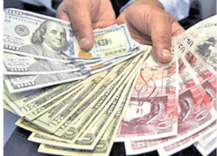
ડોલર વધીને ૫૬૦.૫૩ અરબ ડોલર રહ્યો હતો. એક અગ્રણી સંસ્થા મુજબ વિદેશી મુદ્રા ભંડોળ વધવાનું મહત્વપૂર્ણ કારણ કોરો-

નવી દિલ્હી, તા.૮ કોરોનાથી ખરાબ રીતે પ્રભાવિત થયેલ ભારતીય અર્થવ્યવસ્થા માટે હવે એક પુશાખબર સામે આવી છે. દેશનું વિદેશી મુદ્રા ભંડોળ ૩૦ ઓક્ટોબરે સમાપ્ત અઠવાડિયામાં ૧૮.૩ કરોડ ડોલર વધીને ૫૬૦.૭૧૫ અરબ ડોલરના રેકોર્ડ સ્તરે પહોંચી ગયું છે. કોરોનાને કારણે ભારતની અર્થવ્યવસ્થાની હાલત ખુબ જ ખરાબ થઈ ગઈ હતી. અને આ નાણાકીય વર્ષના પહેલા ત્રિમાસિકમાં દેશની જીડીપીમાં લગભગ ૨૪ ટકાનો ઘટાડો આવ્યો હતો. પણ હાલના દિવસોમાં અર્થવ્યવસ્થા માટે અનેક સારી ખબરો સામે આવવા લાગી છે.