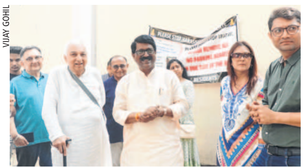
Residents of Malabar Hill with Arvind Sawant

Sawant said that when his party president Uddhav Thackeray was the chief minister, instructions were given to the traffic police not to harass the residents. "However, the situation has changed