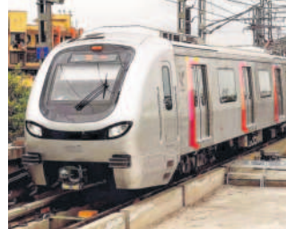
Awarded for a 10-year period, the contract has been made for managing day-to-day operations

The first phase between SEEPZ and Bandra-Kurla Complex is likely to open by December, while the remaining corridor will be travel-ready by June 2024.