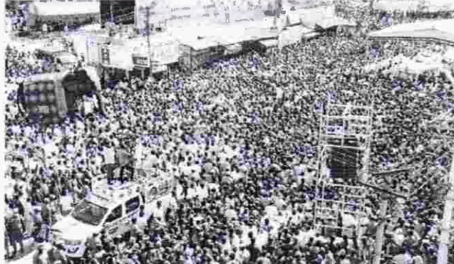
திருப்பூர், 13.2.2021 - விவசாய பாதிப்பு நேரத்தை இன்று 24 மணி நேரம் மும்முனை மின்சாரம் வழங்கப்பட்டு வருவதைத் தி.மு.க. தலைவர் எடப்பாடி பழனிசாமி அறிவித்தார்.

திருப்பூர், 13.2.2021 - விவசாய பாதிப்பு நேரத்தை இன்று 24 மணி நேரம் மும்முனை மின்சாரம் வழங்கப்பட்டு வந்து வருவதைத் தி.மு.க. தலைவர் எடப்பாடி பழனிசாமி அறிவித்தார். திருப்பூர் (மாணா) தீவிர இன்று 2வது நாளாக மும்முனை மின்சாரம் வழங்கப்பட்டு வருவதைத் தி.மு.க. தலைவர் எடப்பாடி பழனிசாமி அறிவித்தார். இன்று 24 மணி நேரம் மும்முனை மின்சாரம் வழங்கப்பட்டு வருவதைத் தி.மு.க. தலைவர் எடப்பாடி பழனிசாமி அறிவித்தார்.