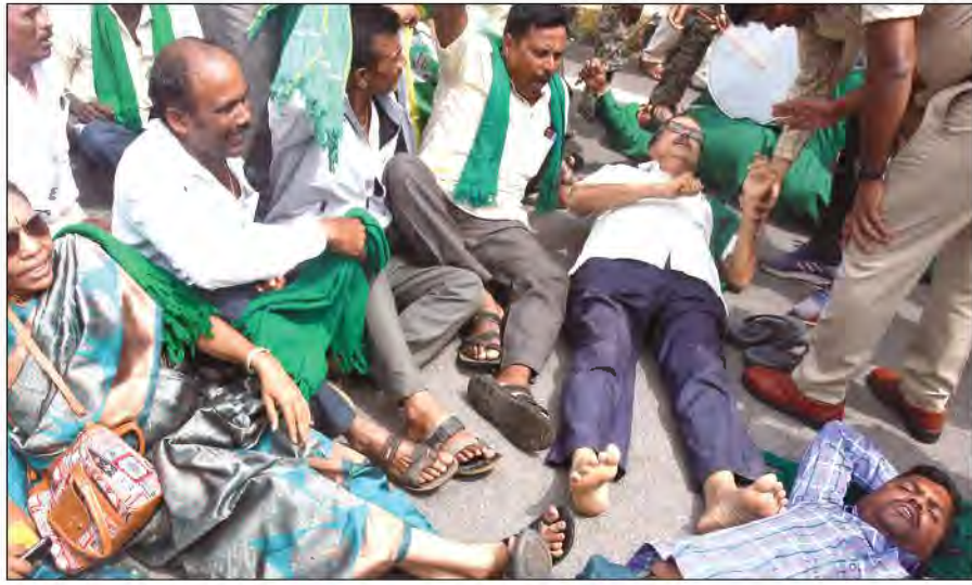
ಕಬ್ಬಿನ ಬಾಕಿ ಹಣ ಕೊಡಿಸುವಂತೆ ಆಗ್ರಹಿಸಿ ಕರ್ನಾಟಕ ರಾಜ್ಯ ಕಬ್ಬು ಬೆಳೆಗಾರರ ಸಂಘದ ವತಿಯಿಂದ ಮೈಸೂರಿನಲ್ಲಿ ಸಿಎಂ ಸಿದ್ದರಾಮಯ್ಯ ಅವರ ನಿವಾಸದ ಬಳಿ ಧರಣಿ ನಡೆಸಿ ಮುತ್ತಿಗೆ ಹಾಕಲು ಯತ್ನಿಸಿದ ರೈತರನ್ನು ಪೊಲೀಸರು ಬಂಧಿಸಿ, ನಂತರ ಬಿಡುಗಡೆ ಮಾಡಿದರು.

ಮೈಸೂರು: ಕಬ್ಬಿಗೆ ಹೆಚ್ಚುವರಿ ದರ ನಿಗದಿ, ಕಳೆದ ವರ್ಷದ ಬಾಕಿ ಹಣ ಕೊಡಿಸುವಂತೆ ಆಗ್ರಹಿಸಿ ರಾಜ್ಯ ಕಬ್ಬು ಬೆಳೆಗಾರರ ಸಂಘದ ವತಿಯಿಂದ ಮುಖ್ಯಮಂತ್ರಿ ಸಿದ್ದರಾಮಯ್ಯ ಅವರ ನಿವಾಸಕ್ಕೆ ಮುತ್ತಿಗೆ ಹಾಕಲು ಯತ್ನಿಸಿದ ರೈತರನ್ನು ಪೊಲೀಸರು ಬಂಧಿಸಿ, ನಂತರ ಬಿಡುಗಡೆ ಮಾಡಿದರು.