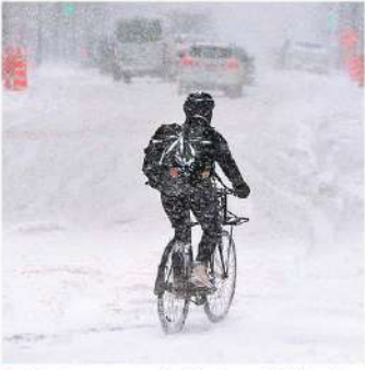
ਮੌਸਮ 'ਚ ਬਦਲਾਅ ਕਾਰਨ ਕੋਵਿਡ-19 'ਚ ਵਧੇਰੇ ਮੌਤਾਂ 'ਚ ਵੀ ਸ਼ਾਮਲ ਹੋ ਰਹੇ ਹਨ। ਤਸਵੀਰ 'ਚ ਮਾਟਰੀਅਲ 'ਚ ਆਏ ਚਲਾਕੀ ਤੁਰਦੇ ਹੋਏ ਇਕ ਸ਼ਹਿਦਾਈ ਸਵਾਰ ਆਪਣੀ ਮੌਜੂਦਗੀ ਸਵਾਰੀ ਵੱਲ ਵੱਧ ਰਿਹਾ।