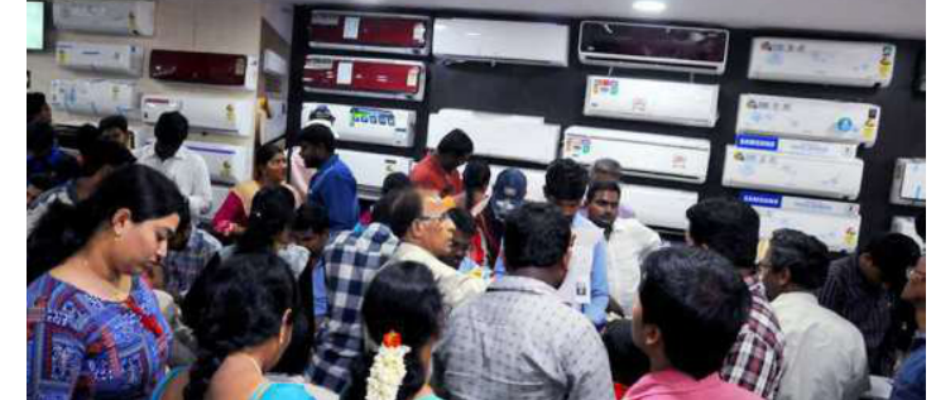
IN DEMAND. Air conditioners, led by split inverter models, saw impressive growth (39 per cent). AC sales grew three times faster than the overall sector

era (September 30-October 13) than the Diwali period." While the Navratri and