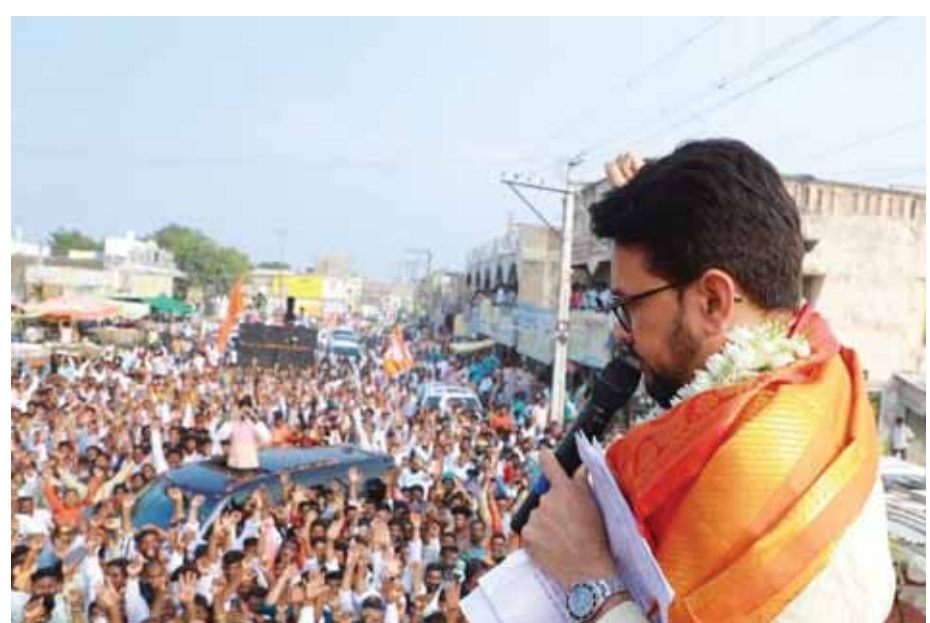
Union Information and Broadcasting Minister Anurag Thakur addresses a rally in Nalgonda district of Telangana as the State goes to poll on November 30. Thakur also conducted a door to door campaign for the BJP candidate in the Palakurthy district on Thursday

guard of honour at the airport. Rajnath and Jaishankar are also scheduled to have separate bilateral meetings with their US counterparts on the sidelines of the '2+2' dialogue that is expected to carry out a comprehensive review of fast-expanding India-US strategic ties. The defence ministry said on Thursday a number of strategic, defence and technology issues are expected to be discussed at the '2+2' dialogue and the bilateral meeting between Rajnath and Austin.