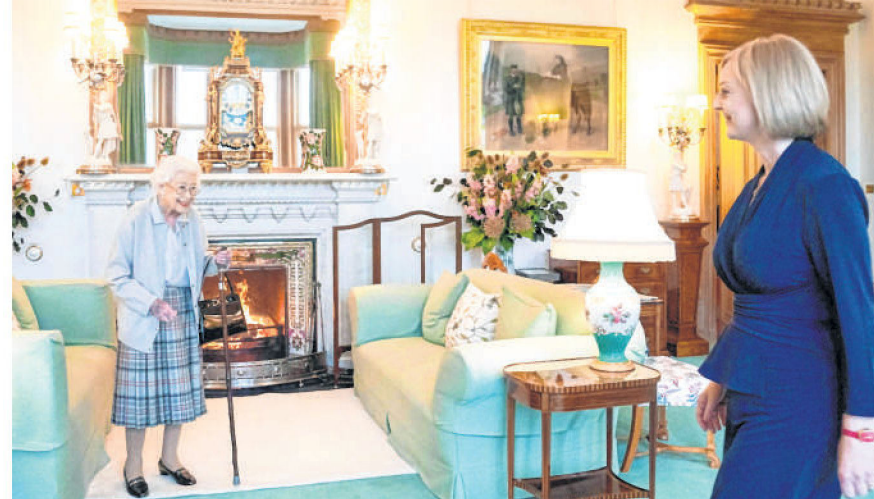
Britain's Queen Elizabeth II and new Conservative Party leader and Britain's Prime Minister-elect Liz Truss meet at Balmoral Castle in Ballater, Scotland, on Tuesday

After her meeting with the Queen, Truss left Balmoral Castle to return to London where she will deliver her inaugural speech as Prime Minister before she begins unveiling her top team in the Cabinet. Attorney General Suella Braverman is expected to be the only Indian-origin MP in her top team, as