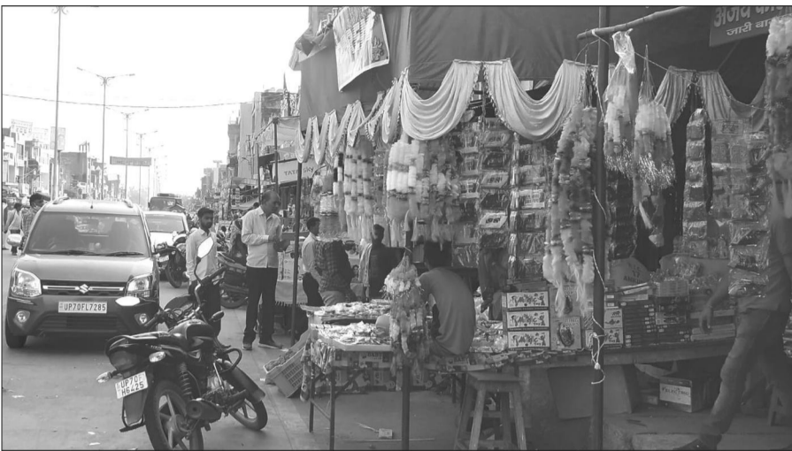
जारी में धनतेरस के पूर्व बाजार में सजी दुकान।

स्वास्तिक और शुभ चिह्नों से सजे हैं, काफी डिमांड में हैं। इनकी कीमत १०० से १००० रुपये तक की है। इसके अलावा हैगिंग दिये भी इस बार काफी डिमांड में हैं। इनके साथ दिवाली पर आजकल दियों के बजाए कैंडल्स की अधिक मांग है। इसके लिए मार्केट में तरह-तरह के कैंडल होल्डर भी बिक रहे हैं। व्यापारी और दुकानदार भारतीय के साथ साथ चाइना के उत्पादों की बिक्री कर रहे हैं। इनमें सबसे ज्यादा वे प्रोडक्ट शामिल हैं जो दिवाली के