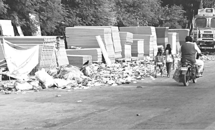
नारीबारी मुख्य बाजार राष्ट्रीय राजमार्ग पर लगा कूड़े का अम्बार।

व्यक्ति के साथ रहकर भी अपने स्वभाव को नहीं बदलता भक्त प्रहलाद विभीषण इसके उदाहरण है। अक्सर पर उपयोग में लिए जाते हैं, जैसे इलेक्ट्रॉनिक सामान, पुस्तिक के डेकोरेटिव आइटम, देवी-देवताओं की मूर्तियाँ, पटाखे और लाइट्स, क्यूँकि ये काफी सस्ते दामों पर मिलते हैं और स्वदेशी आइटम से ज्यादा आकर्षक दिखाई देते हैं। इसी वजह से ग्राहक इनकी ओर खिंचे चले आते हैं। लेकिन इस बार ग्राहक चाइनीज प्रोडक्ट्स को लेने से बचते भी नजर आ रहे हैं। गीतरलब है कि,दीवाली को देखते हुए ज्यादा से ज्यादा ग्राहकों को लुभाने के लिए दुकानदार कोई कसर नहीं छोड़ रहे हैं। दुकानें सजकर ग्राहकों को लुभा रही हैं। दुकानदारों ने दिवाली के लिए खास स्टॉक मंगाया है। इलेक्ट्रॉनिक से लेकर ज्वेलर्स,लाईट्स,मूर्तियाँ और डिजाइनर लाइट्स की दुकानों में लोगों की भीड़ देखी जा रही है। जारी के व्यापारियों ने बताया कि जारी बाजार कस्बे की दुकानों पर पूरे दिन ग्रामीण खरीदारी करने में जुटे रहे बाजारों में ग्रामीणों की बड़ी संख्या देखकर दुकानदारों के चेहरे पर खुशी साफ तौर पर दिखाई दे रही थी सोमवार को बाजारों तथा दुकानों पर दिनभर ग्रामीणों का चहल पहल देखे व्यापारियों ने राहत की सांस ली ज़रूरतमंद वस्तुओं की खरीददारी के लिए बिजली की दुकानों किराने मिठाई तथा अन्य दुकानों पर खरीदारी करने वाले ग्राहकों की भीड़ जुटी रही और चहल-पहल बनी रही