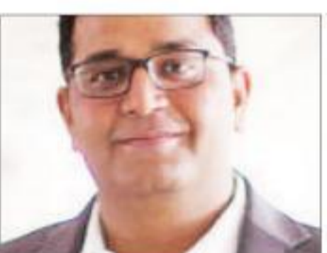
Vijay Shekhar Sharma

"Since the company's listing, its stock price has fallen by 63.6% (from the issue price of ₹2,150), resulting in wealth destruction for shareholders. In FY22, the company reported a cash loss of ₹1,200 crore and losses in Q1 of FY23 were high. Sharma has made several commitments in the past to make