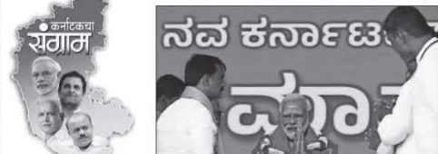
काँग्रेसकडून आतापर्यंत ९१ वेळा माझ्याविरुद्ध अपशब्द - मोदी

काँग्रेसकडून आतापर्यंत ९१ वेळा माझ्याविरुद्ध अपशब्द वापरले आहेत, अशी टीका मतदानात सुरुवातीलाच मोदी यांनी कनाटकमधील प्रचारसभेत केली. त्यांच्या वक्तव्यातून काँग्रेसकडून आतापर्यंत ९१ वेळा माझ्याविरुद्ध अपशब्द वापरले आहेत, अशी टीका मतदानात सुरुवातीलाच मोदी यांनी कनाटकमधील प्रचारसभेत केली. त्यांच्या वक्तव्यातून काँग्रेसकडून आतापर्यंत ९१ वेळा माझ्याविरुद्ध अपशब्द वापरले आहेत, अशी टीका मतदानात सुरुवातीलाच मोदी यांनी कनाटकमधील प्रचारसभेत केली.