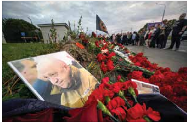
A portrait of Wagner chief Yevgeny Prigozhin being laid at an informal memorial in Russia

The statement didn't offer any details about what might have caused the crash. Russia's civil aviation authority earlier this week said Prigozhin, 62, and some of his top lieutenants were on the list of the passengers and crew members on board the plane. All seven passengers and three crew died