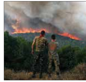
Flames burn a forest during wildfires near Sykorrachi FILE PHOTO

On Sunday, 295 firefighters, seven planes and five helicopters were tackling it, the fire department said. Evacuation orders were issued for two villages, one in the Evros region