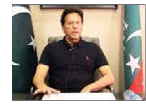
Jailed former Pakistan Prime Minister Imran Khan

The Pakistan Tehreek-e-Insaf (PTI) chairman's interrogation in the matter comes days after he was booked under the Official Secrets Act for making the content of a confidential diplomatic cable from the country's embassy in the US public. The counter-terrorism wing (CTW) of the Federal Investigation Agency