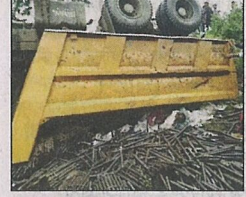
समुद्धी महामार्गाच्या बांधकामावर काम करीत होते.

ठिकाण: नागपूर दिनांक: २१.०८.२०२१ तर्फे नाकोडा ग्रुप ऑफ इंडस्ट्रीज लिमिटेड सही प्रतुल वार्ते (कंपनी संकेतरी)