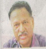
बाहर ना निकलनें, डाक्टर त्वाच और शुगर के स्तर

सर्दी में खून की नलिकाएं सिकुड़ जाती हैं। कार्बन मोनोआक्साइड का स्तर बढ़ने से खून का थक्का जमने की आशंका बढ़ने लगती है। इससे हृदय रोगी और जिन लोगों को खतरा है उन्हें हार्ट अटैक पड़ सकता है। हृदय पर दबाव बढ़ने से क्षमता कम हो सकती है। रक्तचाप बढ़ने से ब्रेन स्ट्रोक भी पड़ सकता है। वायु प्रदूषण वाले स्थलों पर जाने से मरीजों को बचना चाहिए।