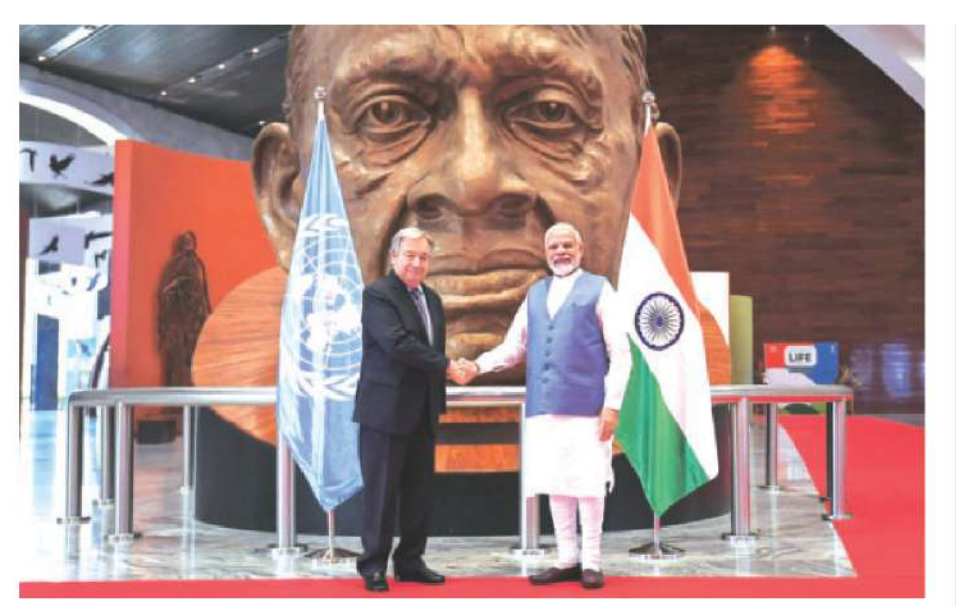
गुजरात के केवड़िया में प्रधानमंत्री नरेंद्र मोदी और संयुक्त राष्ट्र संघ के महासचिव एंतोनियो गुतारेस

प्रधानमंत्री ने कहा कि 'मिशन लाइफ' का मंत्र ' पर्यावरण के लिए जीवनशैली' है। उन्होंने कहा कि इससे लोगों की धरती को बचाने की शक्ति जुड़ेगी और उन्हें बताएगी कि संसाधनों का कैसे बेहतर इस्तेमाल किया जा सकता है। मोदी ने कहा कि 'मिशन लाइफ' जलवायु परिवर्तन के खिलाफ लड़ाई को लोकतांत्रिक बनाएगा जिसमें प्रत्येक व्यक्ति अपनी क्षमता के अनुसार योगदान कर सकता है। उन्होंने कहा, 'मिशन लाइफ हम सभी को अपने दैनिक जीवन में उन कार्यों को करने के लिए प्रेरित करेगा जिससे पर्यावरण की रक्षा होती है। मिशन