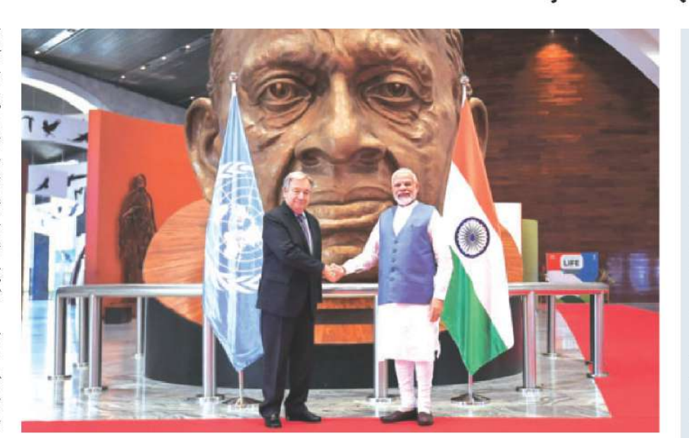
गुजरात के केवड़िया में प्रधानमंत्री नरेंद्र मोदी और संयुक्त राष्ट्र संघ के महासचिव एंतोनियो गुतारेस

प्रधानमंत्री ने कहा कि 'मिशन लाइफ' का मंत्र ' पर्यावरण के लिए जीवनशैली' है। उन्होंने कहा कि इससे लोगों की धरती को बचाने की शक्ति जुड़ेगी और उन्हें बताएगी कि संसाधनों का कैसे बेहतर इस्तेमाल किया जा सकता है। मोदी ने कहा कि 'मिशन लाइफ' जलवायु परिवर्तन के खिलाफ लड़ाई को लोकतांत्रिक बनाएगा जिसमें प्रत्येक व्यक्ति अपनी क्षमता के अनुसार योगदान कर सकता है। उन्होंने कहा, 'मिशन लाइफ हम सभी को अपने दैनिक जीवन में उन कार्यों को करने के लिए प्रेरित करेगा जिससे पर्यावरण की रक्षा होती है। मिशन