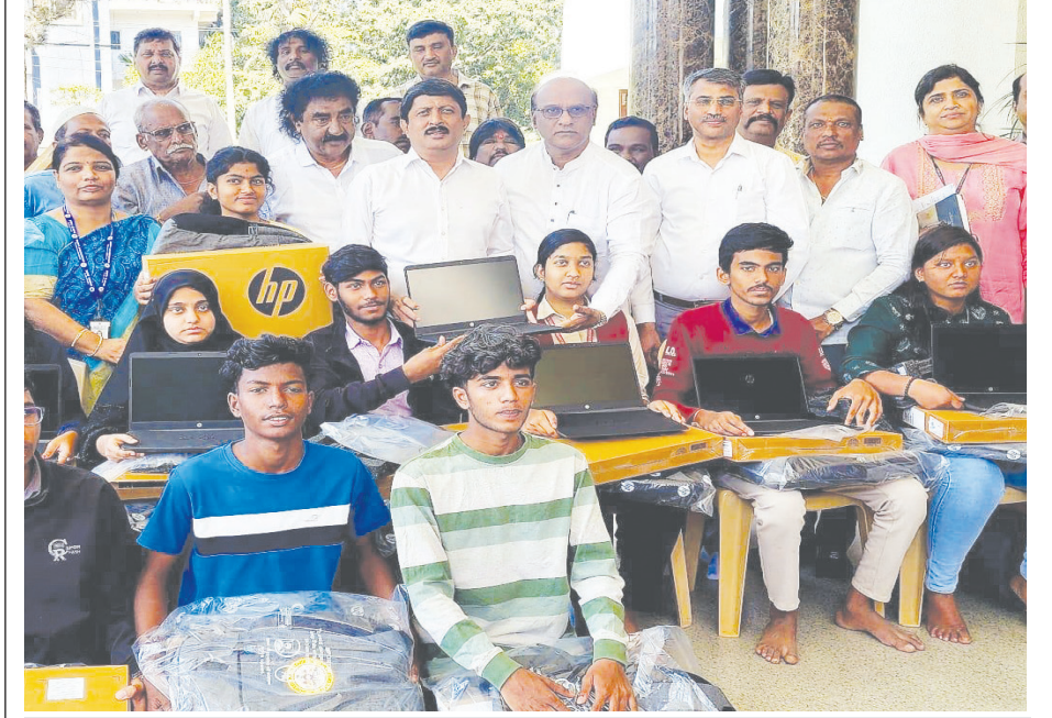
ನಗರಾಭಿವೃದ್ಧಿ, ಯೋಜನೆ ಸಚಿವ ಬೈರತಿ ಸುರೇಶ್‌ರವರು ತಮ್ಮ ಗೃಹ ಕಚೇರಿಯಲ್ಲಿ 2022-23ನೇ ಸಾಲಿನಲ್ಲಿ ಮಂಜೂರಾದ ಹೆಚ್ಚಿನ ಕೇಂದ್ರ 23 ಅರ್ಹ ಫಲಾನುಭವಿಗಳಿಗೆ ಲ್ಯಾಪ್‌ಟಾಪ್ ವಿತರಣೆ ಮಾಡಿದರು. ಮಾಜಿ ಪಾಲಿಕೆ ಸದಸ್ಯ ಅಬ್ದುಲ್ ವಾಜೀದ್ ಹಾಗೂ ಕಾರ್ಮಿಕ ಇಲಾಖೆಯ ಅಧಿಕಾರಿಗಳು ಮತ್ತು ಮುಖಂಡರು ಉಪಸ್ಥಿತರಿದ್ದರು.

ತುಮಕೂರು, ಫೆ. 10- ನಗರದ ಚಿಕ್ಕಮೇಟೆಯ ಗಾರ್ಡನ್ ರಸ್ತೆಯಲ್ಲಿರುವ ಶ್ರೀ ಅಯ್ಯಪ್ಪಸ್ವಾಮಿ ಸೇವಾ ಟ್ರಸ್ಟ್ ವತಿಯಿಂದ ದ್ವಿತೀಯ ಬ್ರಹ್ಮಕಳಶೋತ್ಸವ ಹಾಗೂ ಮಹಾಕುಂಭಾಭಿಷೇಕ ಕಾರ್ಯಕ್ರಮವನ್ನು ಫೆ. 11 ರಿಂದ 18ರ ವರೆಗೆ ಏರ್ಪಡಿಸಲಾಗಿದೆ. ಫೆ. 11 ರಂದು ಬೆಳಿಗ್ಗೆ ಗೋಪೂಜೆ, ಗಂಗಾಪೂಜೆ, ಗುರು ಪ್ರಾರ್ಥನೆ, ಹಿರೇಮಠಾಧ್ಯಕ್ಷರಾದ ಡಾ. ಶ್ರೀ ವಿವಾನಂದ ಶಿವಾಚಾರ್ಯ ಸ್ವಾಮೀಜಿ ಕಾರ್ಯಕ್ರಮ ಉದ್ಘಾಟಿಸುವರು. ಶ್ರೀ ಅಟವಿ ಶಿವಲಿಂಗ ಸ್ವಾಮೀಜಿ ದಿವ್ಯ ಸಾನ್ನಿಧ್ಯವಹಿಸುವರು. ಸಿದ್ದರಬೆಟ್ಟದ ಶ್ರೀ ವಿರಭದ್ರಶಿವಾಚಾರ್ಯ ಸ್ವಾಮೀಜಿ ಅಶೀರ್ವಚನ ನೀಡುವರು. ಫೆ. 14 ರಂದು ಬೆಳಿಗ್ಗೆ 10.50 ರಿಂದ 11.40 ರವರೆಗೆ ಕುಂಭಾಭಿಷೇಕ ಹಾಗೂ ಬ್ರಹ್ಮ