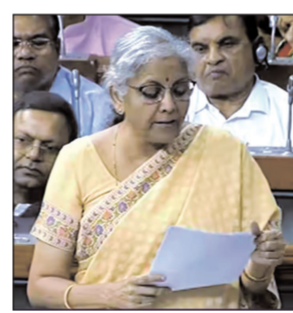
सीतारमण ने कहा कोविड संकट के बाद जहां वैश्विक आर्थिक परिदृश्य धुंधला होता जा रहा है, वहीं भारत की आर्थिक वृद्धि चॉकने वाली है।

भारतीय जनता पार्टी (भाजपा) की नेता एवं केंद्रीय वित्त मंत्री निर्मला सीतारमण ने गुजरात को संयुक्त प्रगतिशील गठबंधन (संग्रह) सरकार के 10 वर्ष के कार्यकाल को भ्रष्टाचार, परिवारवाद, भाई-भतीजावाद से ग्रस्त और झूठे सपने दिखाते हुए कहा कि संग्रह सरकार के कार्यकाल में बैंकों की हालत क्या हो गयी थी, सभी को जानकारी है। अब बैंक रिकॉर्ड लाभ की स्थिति में आ गये हैं। बैंकों का नॉन परफॉर्मिंग एसेट (एनपीए) घटा है। पिछली तिमाही में भारतीय स्टेट बैंक ने रिकॉर्ड लाभ कमाया है। श्रीमती सीतारमण ने कहा आज देश में विश्व स्तरीय डिजिटल इन्फ्रास्ट्रक्चर विकसित हो रहा है। पहले प्रौद्योगिकी का आयात किया जाता था, अब देश प्रौद्योगिकी का निर्यात करता है।