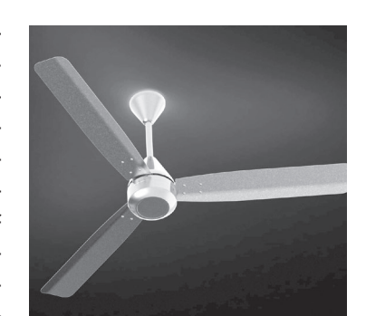
एनर्जियन ग्रूव्ह फक्त २८ वॅट ऊर्जेचा वापर करतो.

कारण ॲक्टिव्ह बीएलडीसी मोटर तंत्रज्ञानाची शक्ती.