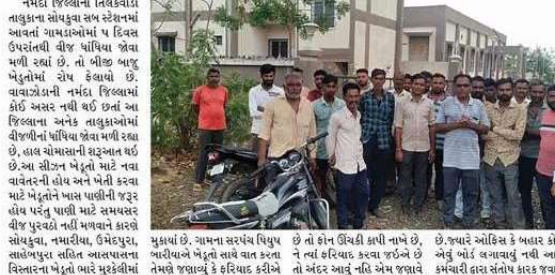
રાજપીપળા, તા.૨૧ નમદા જિલ્લાના તિલકવાડા તાલુકાના સોમકુવા સરકારનાં આવાસ ગામડાઓમાં ૫ દિવસ ઉપરાંતથી વીજ ધાંધિયા થવા મુશ્કેલી રહ્યાં છે. તો ઓછા બાજુ ખેડૂતોમાં રોષ ફેલાયું છે.

વીજ કંપનીનાં કર્મચારીઓની દાદાગીરી: ખેડૂતો ત્યાં ફરિયાદ કરવા જાય તો અંદર આંબું નહિ એમ જણાવે છે