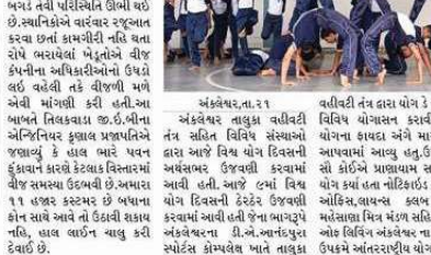
અંકલેશ્વર, તા.૨૧ અંકલેશ્વર તાલુકા વતીની ૨૦ સંઘર્ષ નિમિત્તે વિવિધ સંસ્થાઓ દ્વારા આજે વિષય યોગ દિવસના અંકલેશ્વર ઈજવડી કરવામાં આવી હતી. આજે યોગ દિવસની ટેકર ઈજવડી કરવામાં આવી હતી જેના બાજુએ અંકલેશ્વરના ડી.એ.આર.પુસ્તક સેન્ટરમાં કોલેજલેય પાતે તાલુકા