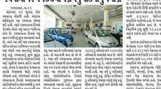
અમદાવાદ, તા.૨૧ સંઘર્ષમાં ૨૦ જૂનના રોજ રથયાત્રા નીકળી હતી. એકમ ક્ષતિગ્રસ્ત આ રથયાત્રા સેવા પર હતી. ત્યાર બાદ રથયાત્રા ડિલરે કોરોના બંધર ઓફર આપવામાં આવી હતી. આ બંધર ઓફર આપવામાં આવી હતી. આ બંધર ઓફર આપવામાં આવી હતી.