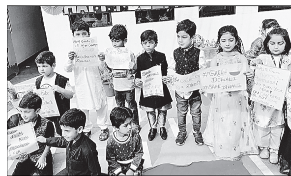
मुरादाबाद के यूको किड्स प्ले स्कूल में आयोजित कार्यक्रम में मौजूद बच्चों।