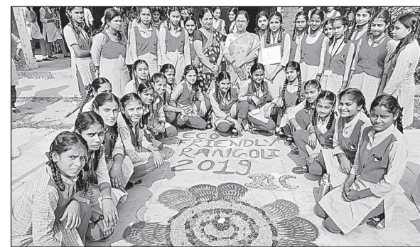
मेथोडिस्ट स्कूल में रंगोली बनाती छात्राएं।