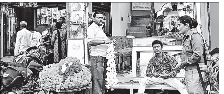
गुरुवार को मुरादाबाद के बाजार में सुरक्षा के मद्देनजर तैनात महिला पुलिसकर्मी।