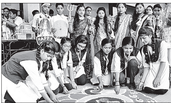
मुरादाबाद के एसडीएम इंटर कालेज में रंगोली सजाती छात्राएं।

शहर के विभिन्न स्कूलों में गुरुवार को दीपावली उत्सव धूमधाम से मनाया गया। कहीं दीप सजे तो कहीं बच्चों ने रंग-बिरंगी रंगोली से विद्यालय का प्रांगण सजाया। गीत, संगीत और नृत्य की प्रस्तुतियां खास रही। बच्चे राम, सीता, लक्ष्मण और हनुमान की वेशभूषा में नजर आए। केसीएम स्कूल: दीपावली के उपलक्ष्य में विभिन्न कार्यक्रमों का आयोजन किया गया। सीनियर कक्षाओं की छात्राओं ने रंगोली प्रतियोगिता में अपनी प्रतिभा का प्रदर्शन किया। सनसिटी पब्लिक स्कूल: रंगोली व दीप सज्जा प्रतियोगिता का आयोजन किया गया। कक्षा दूसरी से चौथी तक की कक्षाओं में रंगोली प्रतियोगिता का आयोजन किया गया। कक्षा दूसरी से चौथी तक की कक्षाओं में रंगोली प्रतियोगिता का आयोजन किया गया। कक्षा दूसरी से चौथी तक की कक्षाओं में रंगोली प्रतियोगिता का आयोजन किया गया।