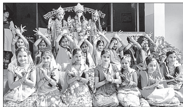
मुरादाबाद के साहू रमेश इंटर कालेज में कार्यक्रम प्रस्तुत करती छात्राएं।