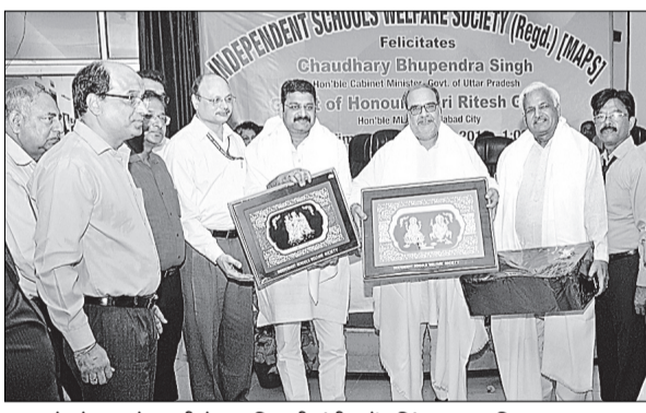
स्कूल वेलफेयर सोसायटी के पदाधिकारी मंत्री भूपेंद्र सिंह व शहर विधायक का सम्मान करते हुए।

अंकुश लगाने के लिए इस बार सर्राफा दुकानों को विशेष रूप से सुरक्षा दी जा रही है। इसके तहत जहां तीन से पांच दुकानें हैं वहां दो सिपाही, जिस बाजार में दस दुकान तक हैं वहां तीन से चार सिपाही हथियारों के साथ तैनात किए गए हैं। इसके अलावा जहां केवल एक दुकान होगी वहां भी एक सशस्त्र सिपाही तैनात किया गया है। जिले के सभी थाना प्रभारियों को निर्देश दिया गया है कि वह इस आदेश का अपने बाजार में कड़ाई से पालन कराएं। बाजार में सादे कपड़ों में भी सिपाहियों को ड्यूटी लगाई गई है, जो संदिग्धों पर नजर रखेंगे। थानों की लैपटॉप और पुलिस टीम बाजार में पेट्रोलिंग करेगी। यूपी 100 की गाड़ियों को भी त्योहार तक बाजारों और भीड़भाड़ वाले इलाकों में गश्त करते हुए नजर रखने को कहा गया है। एसएसपी ने कहा कि त्योहार पर यदि कोई व्यवस्था बिगाड़ने का प्रयास करेगा तो पुलिस उससे सख्ती से निपटेगी। किसी भी तरह की वारदात करने वाले को तत्काल गिरफ्तार कर कार्रवाई की जाएगी।