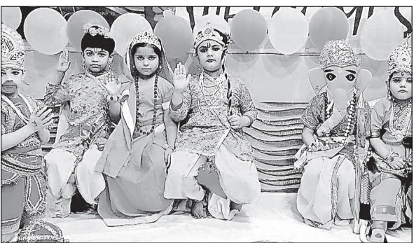
मुरादाबाद के संवेदना किड्स स्कूल में देवी-देवताओं की वेशभूषा में सजे बच्चों।