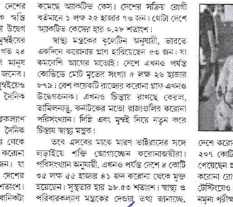
গত কয়েকদিনে দেশের বিভিন্ন পর্যায়ে করোনা সংক্রমণের হার বাড়তে শুরু করেছে।

নয়াদিল্লি, ১১ অগস্ট: গত কয়েকদিনে দেশের বিভিন্ন পর্যায়ে করোনা সংক্রমণের হার বাড়তে শুরু করেছে। দিল্লি, মুম্বইয়ে ফের চোখ রাখাচ্ছে করোনা সংক্রমণ। গত কয়েকদিনে দেশের বিভিন্ন পর্যায়ে করোনা সংক্রমণের হার বাড়তে শুরু করেছে।