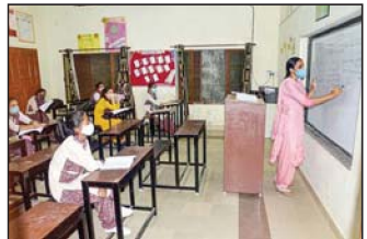
દેશમાં કોરોના લોકડાઉનને કારણે પંજાબ સહિતના રાજ્યોમાં કોરોના કેસ ઘટતાં નિયંત્રણો હળવા કરાતા મહિનાઓ સુધી બંધ રહેલી સ્કૂલો ફરીથી ખોલવામાં આવતા નવા કરવાનું શિક્ષણ કાર્ય શરૂ થયું છે. પંજાબના અમુતસરમાં પાંચી ગણેલી એક સ્કૂલના વર્ગખંડમાં માસ્ટર પહેરીને એક શિક્ષિકા વિદ્યાર્થીઓને વર્ગમાં અને સાથે સાથે ઘેર રહેવાનો ઓનલાઈન વીડિયો મારફતે ભણાવી રહી છે.

પોતાની મિત્ર ભારતમાં અંગે મેહુલ ચોકસીને જણાવ્યું કે, તેણે અને પહેલા નામથી જ ઓળખે છે. તે સિવાય મેહુલ ચોકસીને ગુસ્સીત અને ગુસ્સાનો ઓળખા હતા અને તે લોકો જ ભારતમાં વહે આવ્યા હોવાનું જણાવ્યું હતું. મેહુલના કહેવા