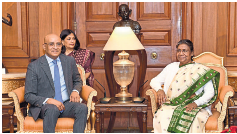
President Droupadi Murmu (right) with Bharat Jagdeo (left), vice president of Guyana at Rashtrapati Bhawan, in New Delhi.

"Next year, ExxonMobil will have to give up 20% of their holdings. So, all of those will be available for some form of bilateral