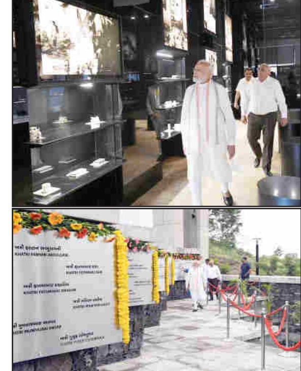
ભુજ : કચ્છમાં આવેલા વિનાશકારી ભૂકંપનાં હજારો લોકોને પોતાના જીવ ગુમાવ્યા હતા. વર્ષ ૨૦૦૧ના ભૂકંપનો ભોગ બનેલા દિવગંતોની યાદમાં ભુજના ભુજિયા ડુંગરની તળેટીમાં સ્મૃતિવન અર્થકેવક મેમોરિયલનું નિર્માણ થયું છે. ૪૭૦ એકમમાં પથરાયેલા સ્મૃતિવનનું લોકાર્પણ ગત વર્ષ વડાપ્રધાન નરેન્દ્રભાઈ મોદીના હસ્તે કરવામાં આવ્યું હતું. ઇલ્લા એક વર્ષ દરમિયાન પાંચ લાખથી વધુ લોકો સ્મૃતિવનની મુલાકાત લઈ ચૂક્યા છે. આ ઉપરાંત એક જ દિવસમાં ૨૭૦૦ લોકોને મ્યુઝિયમ નિહાળી કીર્તિમાન સ્થાપિત કર્યો હતો. સ્મૃતિવનના લોકાર્પણને એક વર્ષ પૂર્ણ થયાના ઉપલક્ષ્યમાં

સ્મૃતિવનના લોકાર્પણના એક વર્ષ પૂર્ણ થયાના ઉપલક્ષ્યમાં વડાપ્રધાને કચ્છી દિવટ: લોકોને મ્યુઝિયમની અચૂક મુલાકાત લેવા કર્યો અનુરોધ