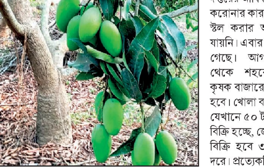
বাঁকুড়ায় ফলেছে প্রচুর আম।

আবার চাহিদাও বেশি। দেশের চারটি রাজ্যে এবার প্রায় ৫০০ মেট্রিক টন আম্রপালি রপ্তানি হবে। রাজ্যগুলি যথাক্রমে মহারাষ্ট্র, উত্তরপ্রদেশ, বিহার এবং ঝাড়খণ্ড।