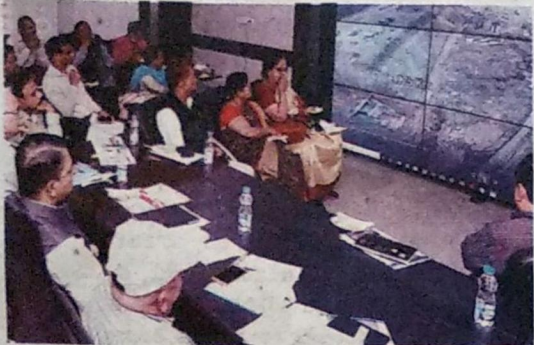
నవతెలంగాణ ప్రత్యేక ప్రసంగి