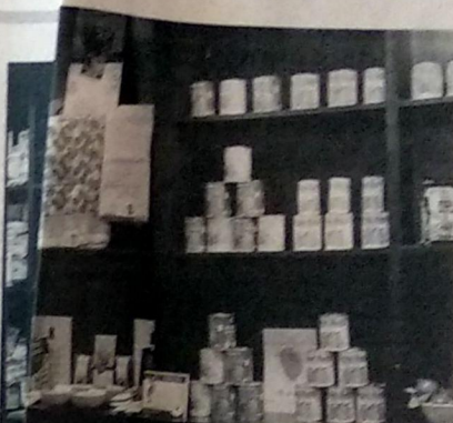
Shop in Goa, it offers a mix of traditional crafts, food and textiles

led by origin v store for GI tagged products at the Goa imment looks to build a premium label fre