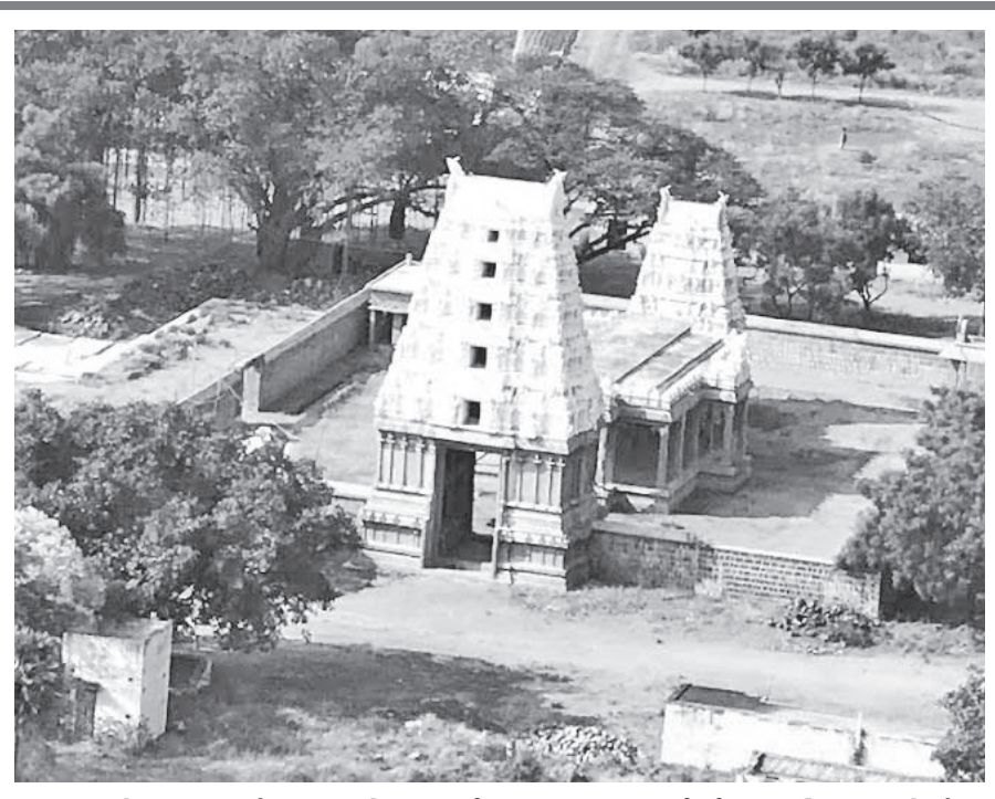
ஆயிரமாண்டு தொன்மை வாய்ந்த கோயில்