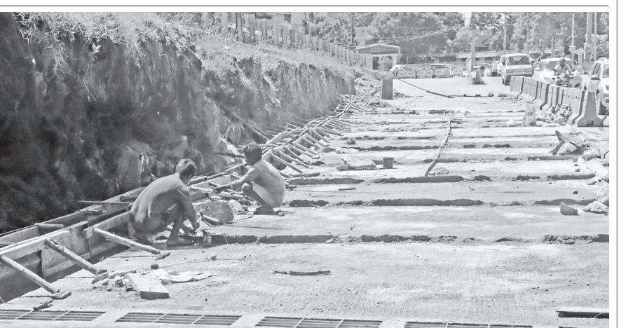
ஈரோடு கொல்லம்பாளையம் ரயில்வே நுழைவு பாலத்தின் அடிப்பகுதியில் பராமரிப்பு பணிகள் தீவிரமாக நடந்து வருகிறது.